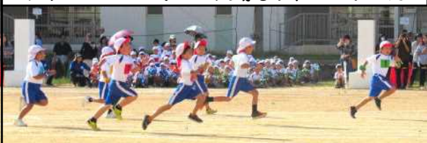
ブリンバンボンの入場もかわいかった