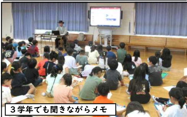
3学年でも聞きながらメモ