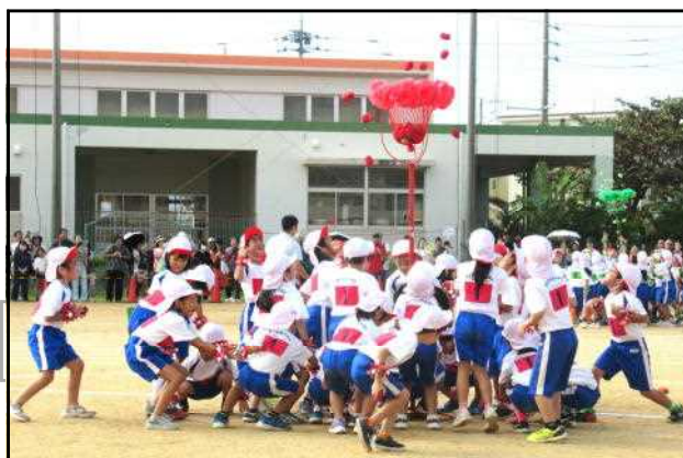
かけっこも「ポーズ」と「笑顔の走り」が最高

さて、主役は子供達ですので、早速自慢の子供達をご紹介致します。まずは、1年生、玉入れの力量を上げたのか写真のように狙ったところに玉が…。