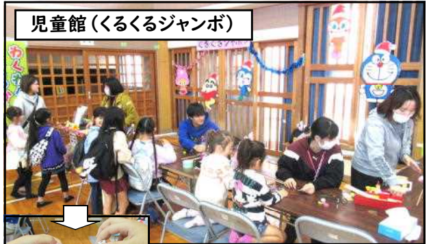
児童館(くるくるジャンボ)