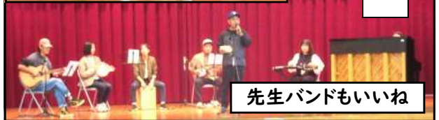
先生バンドもいいね