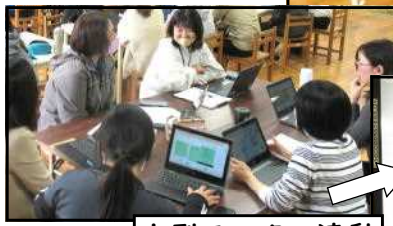
大型モニター連動