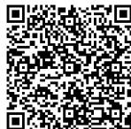
宿題解答 QR コード