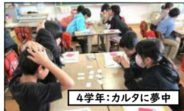
4学年:カルタに夢中

初めての「筆使い」ですので、外部講師の先生方が丁寧に「持ち方」「運び方」などを指導して下さいました。また、4学年は「かるた遊び」にも挑戦し、真剣な顔で勝負に集中してました。