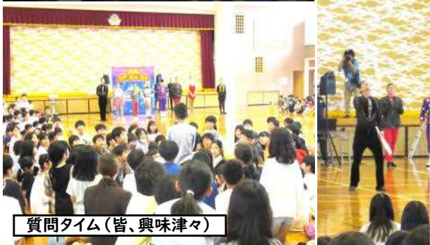
質問タイム(皆、興味津々)