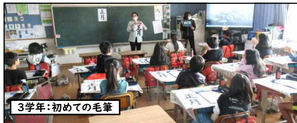
3学年:初めての毛筆

初めての「筆使い」ですので、外部講師の先生方が丁寧に「持ち方」「運び方」などを指導して下さいました。また、4学年は「かるた遊び」にも挑戦し、真剣な顔で勝負に集中してました。